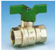
Femelle-Femelle Poignée papillon