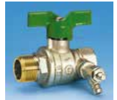
Mâle-Femelle à purge Poignée papillon