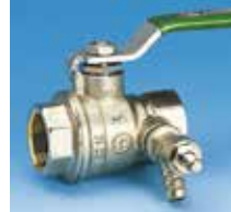
Femelle-Femelle à purge Poignée plate