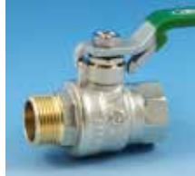
Mâle-Femelle Poignée plate