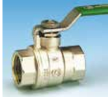
Femelle-Femelle Poignée plate