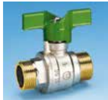
Mâle-Mâle Poignée papillon