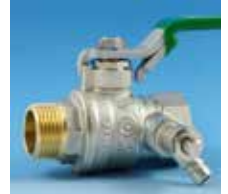
Mâle-Femelle à purge Poignée plate