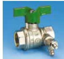
Femelle-Femelle à purge Poignée papillon