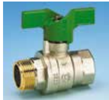
Mâle-Femelle Poignée papillon