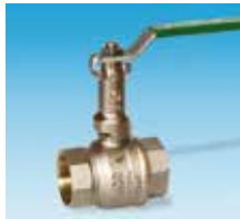
Femelle-Femelle Poignée plate avec rallonge