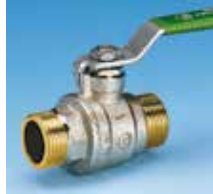
Mâle-Mâle Poignée plate